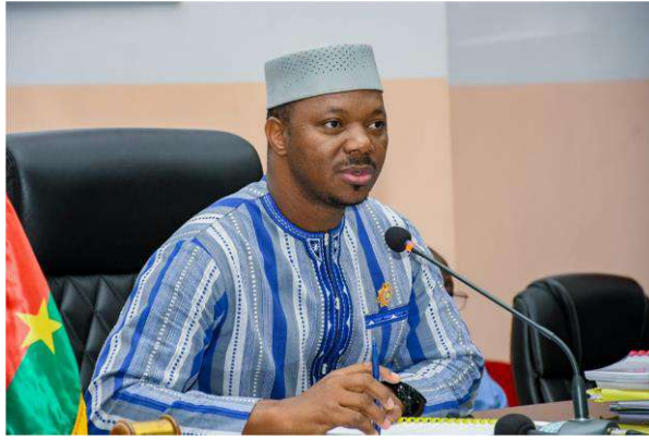
Sous le Haut Patronage du Docteur Ousmane BOUGOUMA Président de l'Assemblée Législative de Transition