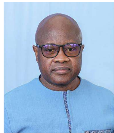
Sous la Co-présidence du Docteur Robert Lucien Jean Claude KARGOUGOU Ministre de la Santé et de l'hygiène publique